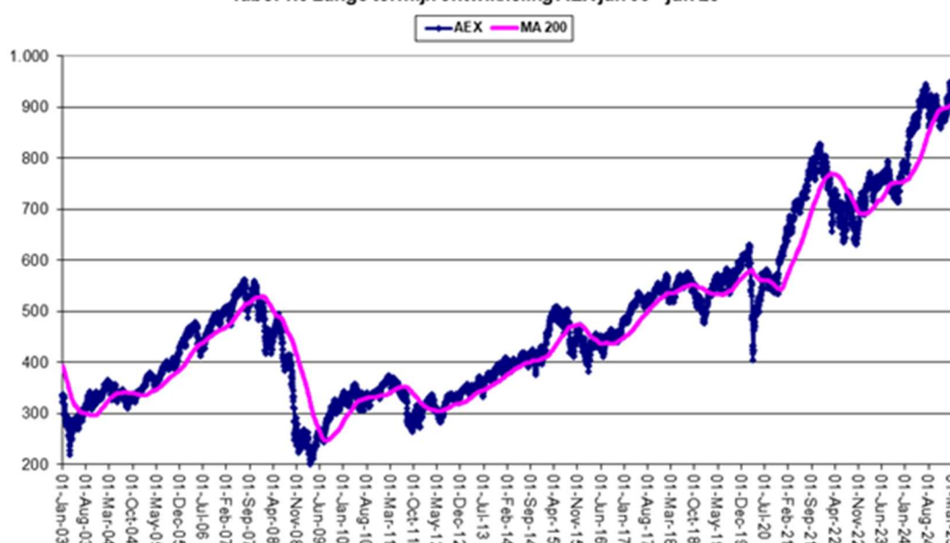
Tabel 1.3 Lange termijn ontwikkeling AEX jan 03 - jun 25

De belangrijkste Europese index, de Duitse DAX, vertoont daarentegen een duidelijk stijgende trend.