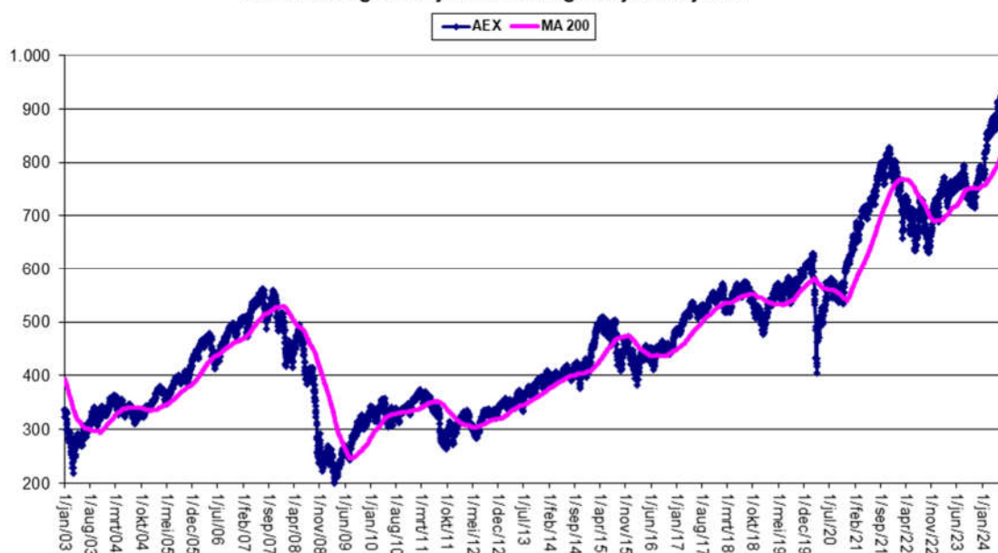
Tabel 1.3 Lange termijn ontwikkeling AEX jan 03 - jun 24

De AEX vestigde in juni opnieuw een record. Vergeleken met een 200-daags voortschrijdende gemiddelde, is het duidelijk dat de Nederlandse aandelenmarkt zich in een sterk opwaarts momentum bevindt. Dit wordt veroorzaakt door een beperkt aantal aandelen die zwaar doorwegen in deze marktkapitalisatie-gewogen index.