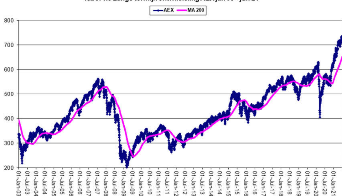
Tabel 1.3 Lange termijn ontwikkeling AEX jan 03 - jun 21

De AEX-index handelt nog steeds ruim boven het voortschrijdend gemiddelde van 200 dagen. Zorgen hebben nog steeds geen plaats in deze markt.