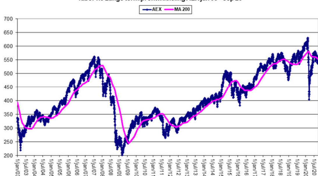
Tabel 1.3 Lange termijn ontwikkeling AEX jan 03 - sep 20

De AEX index handelt net onder zijn voortschrijdend 200-daggemiddelde. De onderliggende economie is zwak maar hersteld scherp van het horror kwartaal in Q2. Centrale banken en regeringen zullen de economie blijven ondersteunen en zullen, zoals de FED's beleidswijziging bewijst, een tandje bijsteken wanneer nodig.