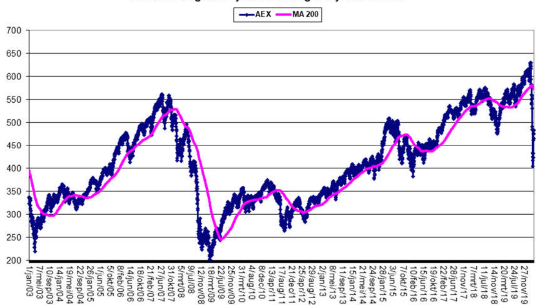
Tabel 1.3 Lange termijn ontwikkeling AEX jan 03 - mrt 20

Net zoals de andere indices heeft de AEX een zwak kwartaal achter de rug. De Nederlandse index viel wel minder hard dan haar Europese peers die door hun grotere afhankelijkheid van industriële export meer te verliezen hadden bij een algemeen economisch terugval.